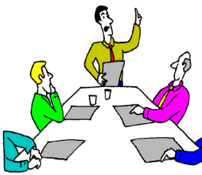
Van de bestuurstafel.

Zo buurtbewoners, al weer de laatste krant van 2014, wat gaat zo'n jaar toch snel. Het was een enerverend jaar, veel bezuinigingen in de thuiszorg en andere vormen van zorg, dit gaat m.i. wel erg snel allemaal. Het wordt gebracht alsof het in ons belang zou zijn, daar heb ik persoonlijk mijn twijfels over, maar dat het goedkoper kan dat denk ik wel. Ook dat we meer onze eigen verantwoordelijkheid moeten nemen voor onze eigen gezondheid en welzijn, daar sta ik wel achter. Ik heb dan ook, samen met mijn medebestuurders, het voornemen om begin 2015 iets aan voorlichting over de WMO te organiseren.